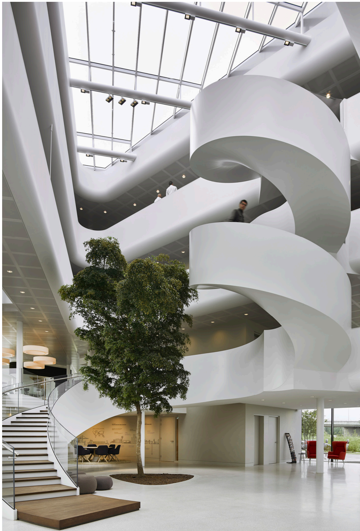
EeSoffit™ by EeStairs