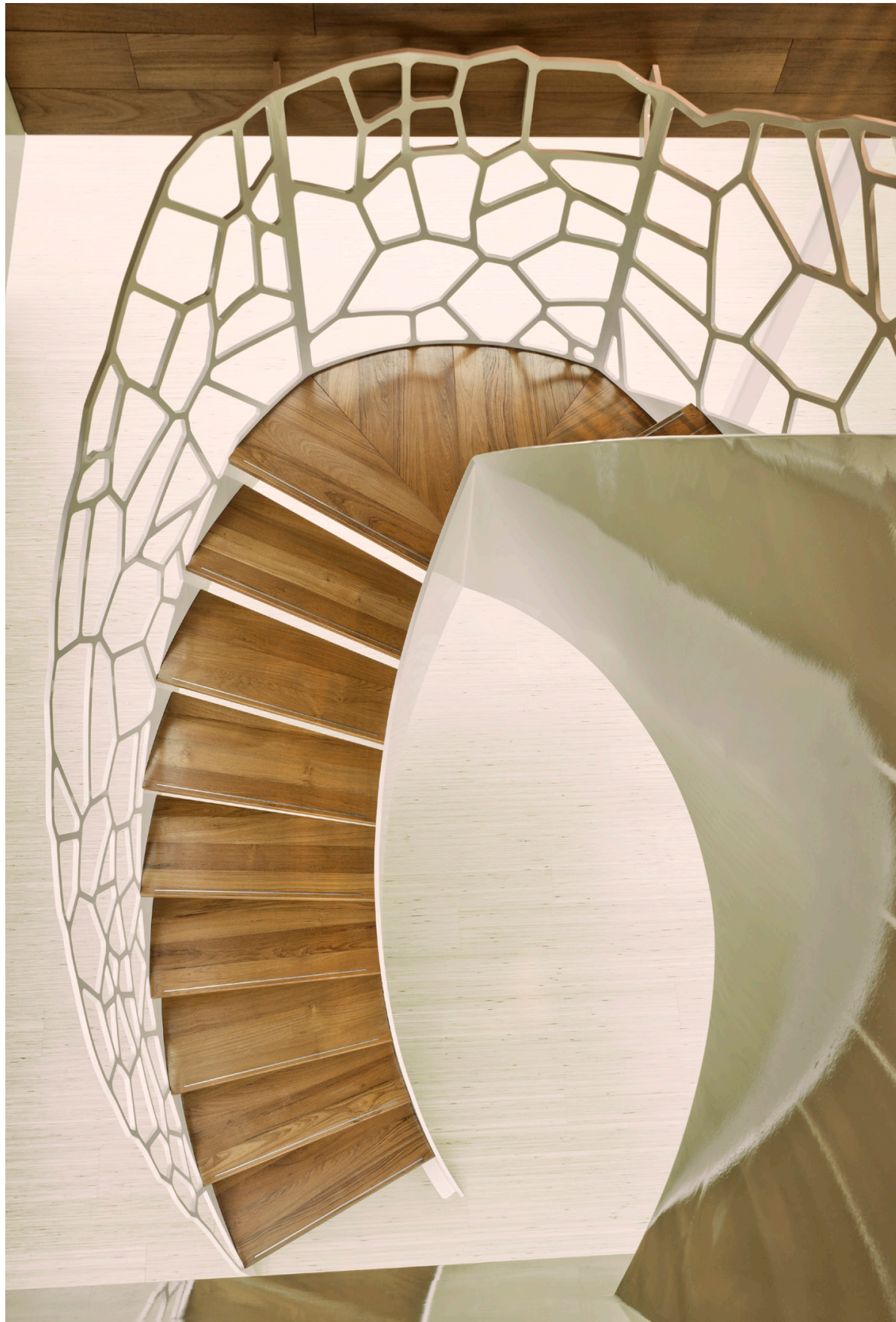
Cells™ by EeStairs